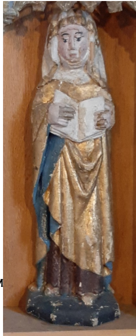
HELIGA BIRGITTA I KORPO KYRKA

VI ÄR OLIKA, MEN INGEN ÄR SKAPAD TILL ENSAMHET. NÄR VI TONAR TILLSAMMANS BLIR DET SKÖNA HARMONIER.